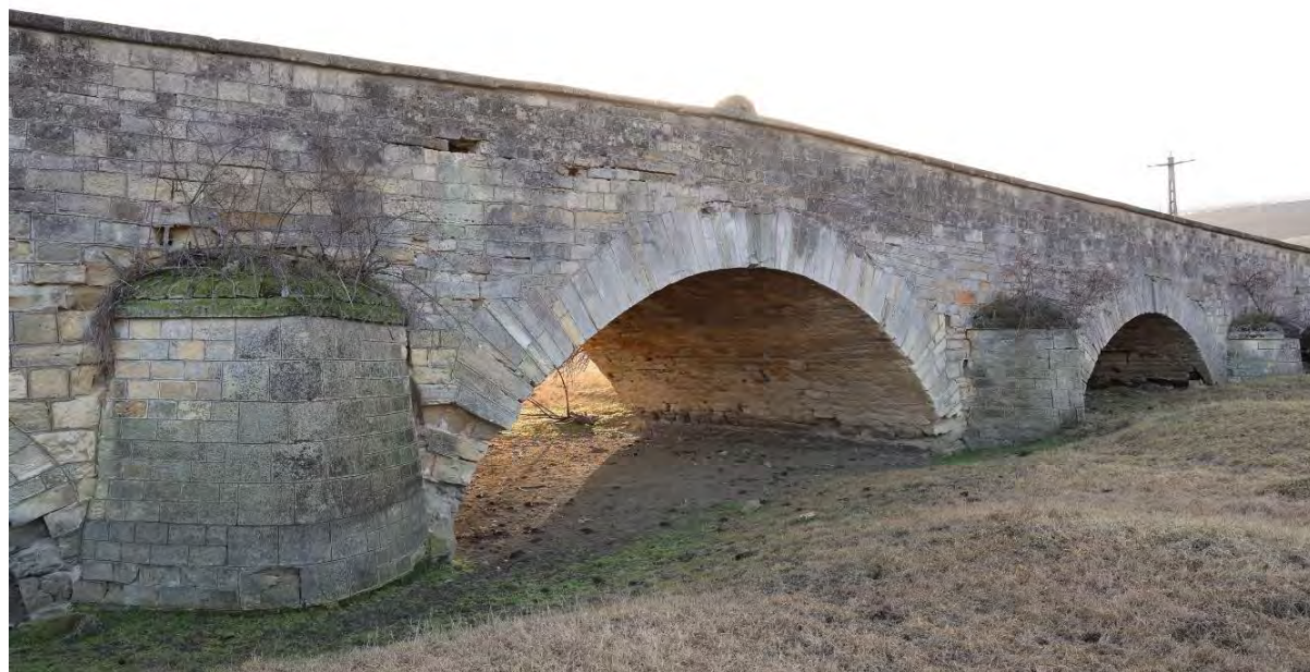
Podul Doamnei – vedere „sparge val” latura nordică, ianuarie 2023