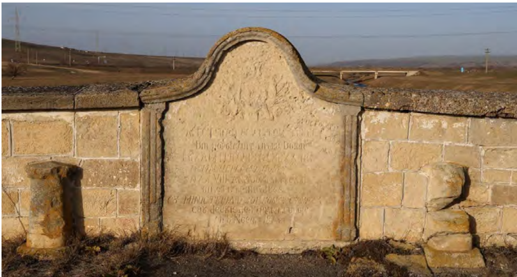
Podul Doamnei – piatră decorată cu stemă și inscripții parapet nordic, ianuarie 2023