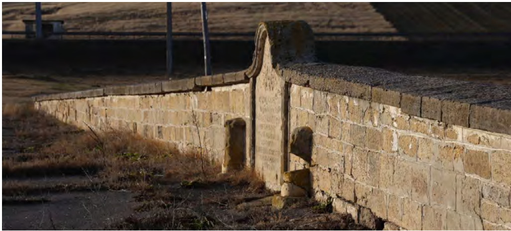
Podul Doamnei – piatră decorată cu stemă și inscripții parapet nordic, ianuarie 2023