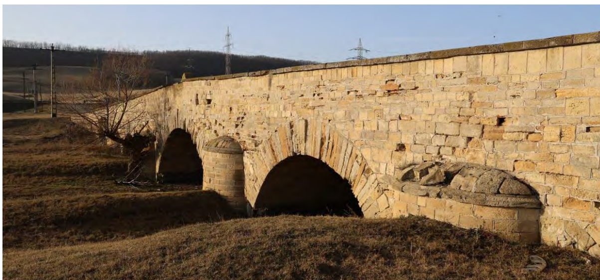
Podul Doamnei – vedere contraforți latura sudică, ianuarie 2023