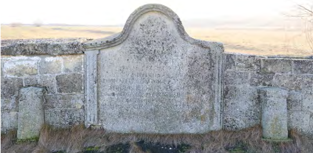
Podul Doamnei – piatră decorată cu stemă și inscripții parapet sudic, ianuarie 2023