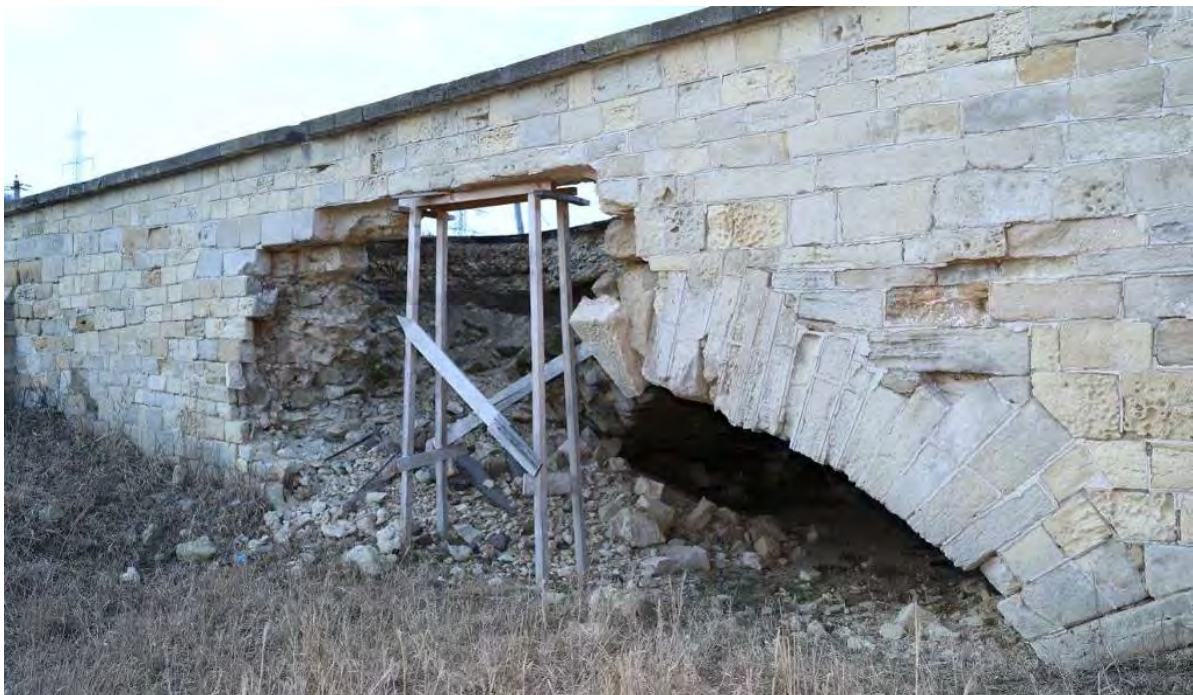
Podul Doamnei – prima bolta de pe latura de sud, prăbușită și eșafodajul degradat, ianuarie 2023