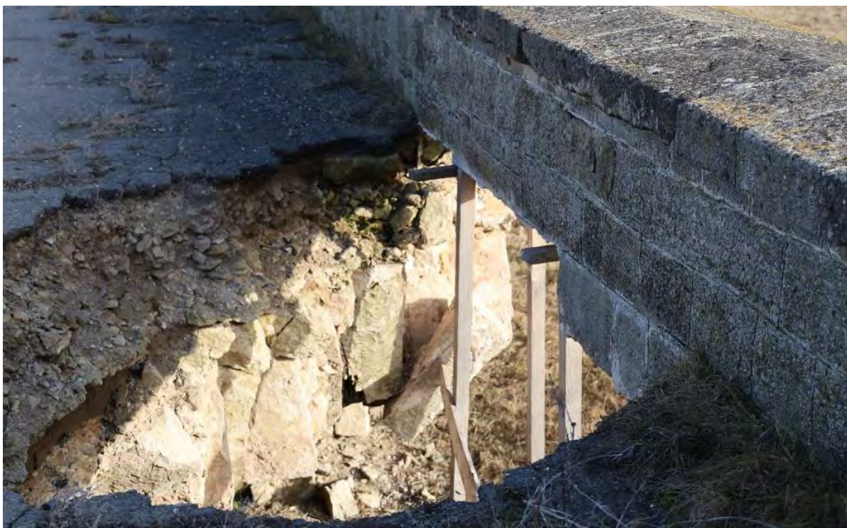
Podul Doamnei – prima bolta de pe latura de sud, prăbușită, ianuarie 2023