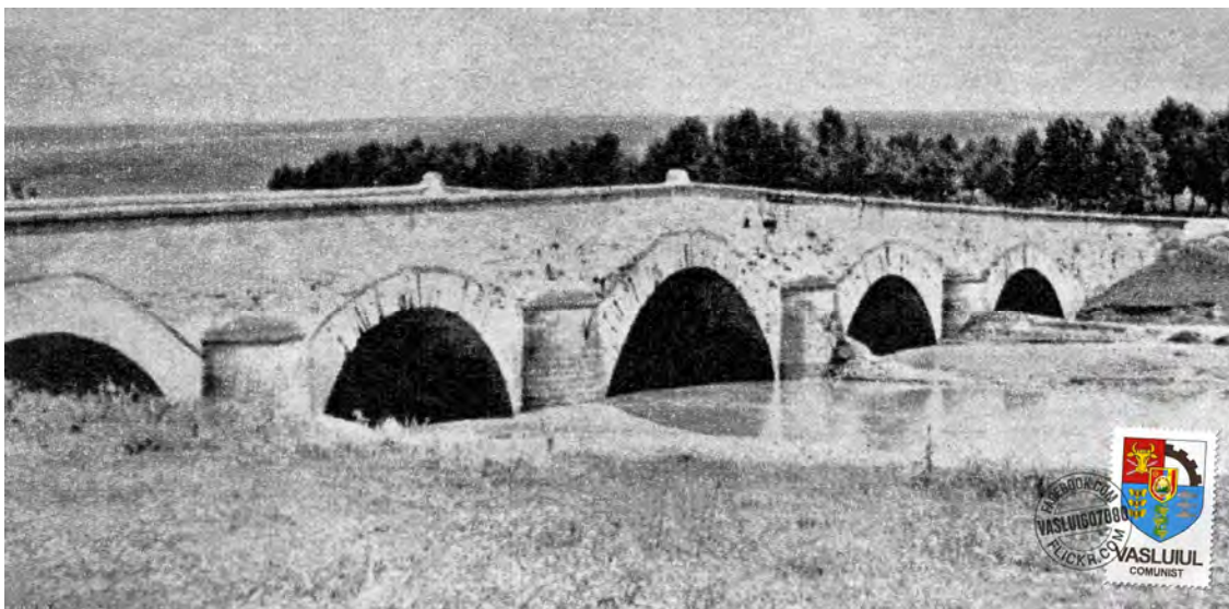
Podul Doamnei, 1972