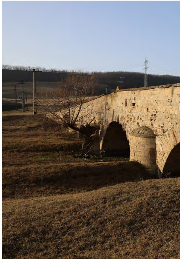
Podul Doamnei – plante invazive, 2023