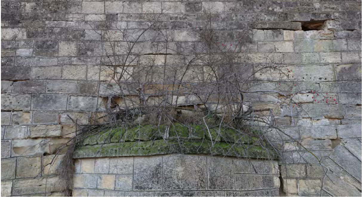
Podul Doamnei – plante invazive, 2023